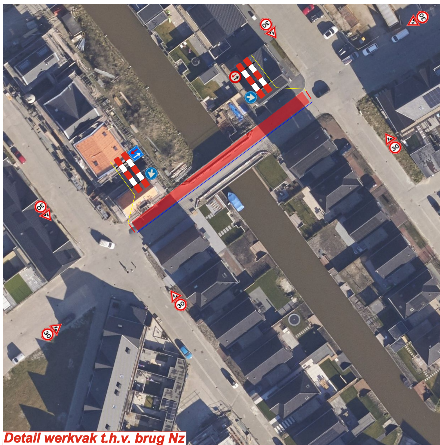
Detail werkvak t.h.v. brug Nz