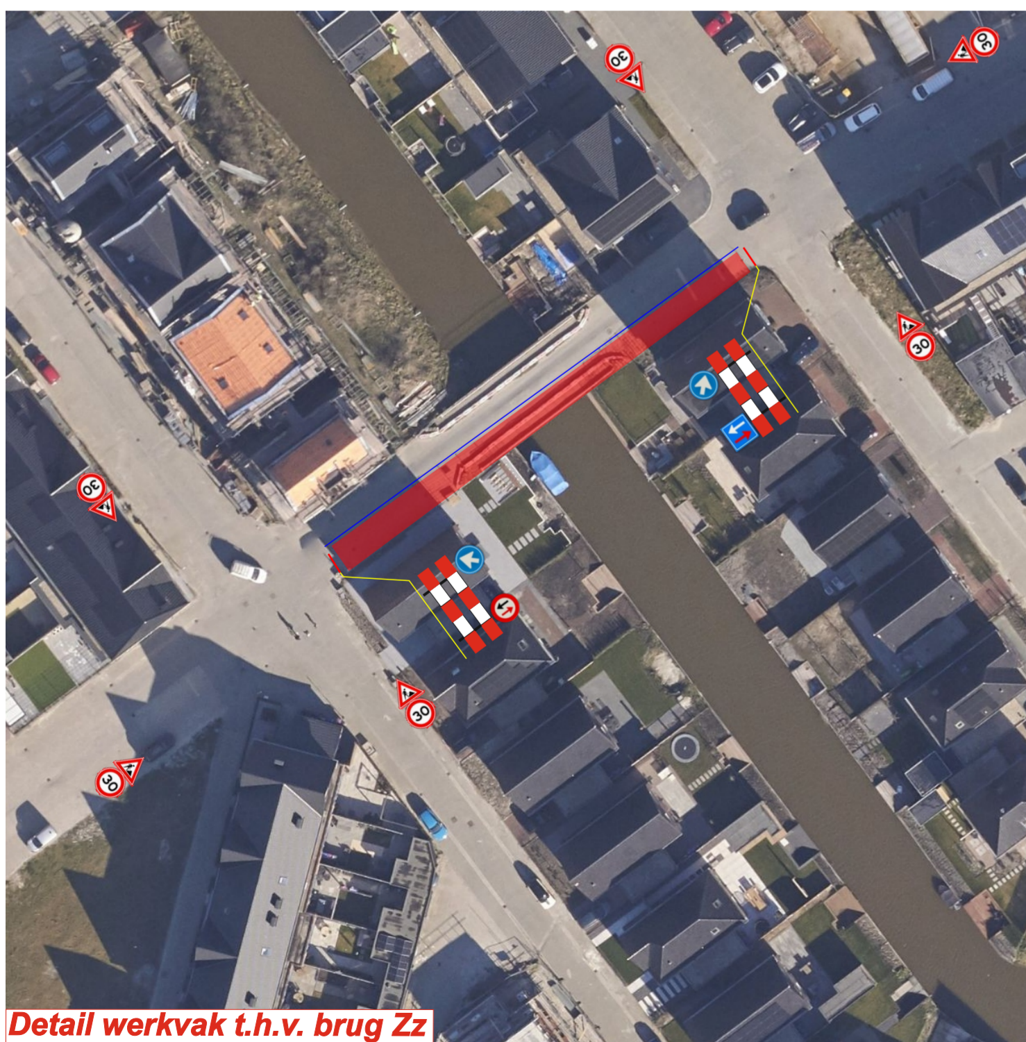
Detail werkvak t.h.v. brug Zz